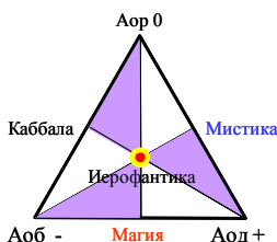
Рис. 3. Вихревая триграмма-3.

Единоновременно из этого центра излучается триединая сила, обозначенная на рис. 3 гранями (ребрами) трех малых треугольников, вписанных в основной треугольник.