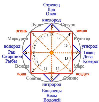
Рис. 2. Нонаграмма-9 элементарных и человеческих инкарнаций.

3. Воздух. Круг Балсериче- ский. Инкарнации полусуществ в стихии воздуха, гор и пропа- стей — сильфы и сильфеи, лоре- лей и лорелиессы, арии (горные), перриды (духи иллюзий), форре- лоны (снежные).